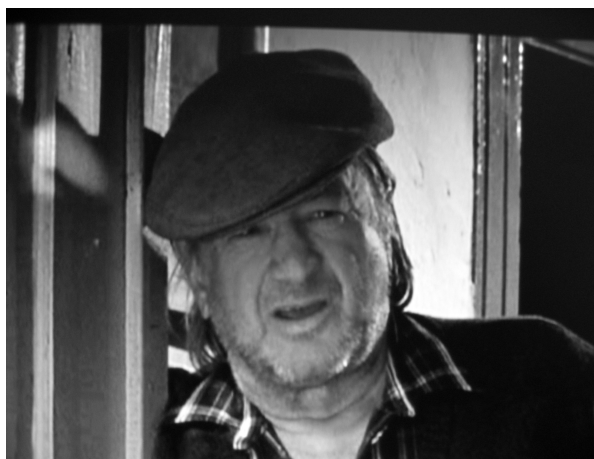
Slovenský herec pan Ivan Palúch

O čem vlastně film je? O tom, jak lidé dovedou být zlí, když se jim někdo znelíbí. O tom, jak lidé raději věří hloupostem než svému rozumu. A také o tom, jak to někdy skutečně chodí na malé vesnici.