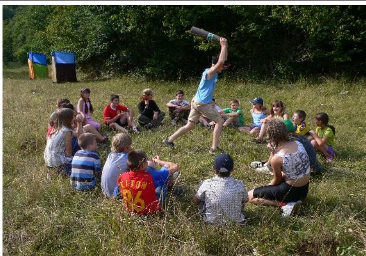
Hry, koně a večerní meditace u stroje